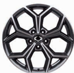
18 colos "Diamond Cutting" könnyűfém felni 235/55R gumikkal